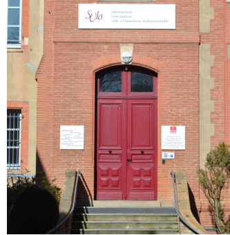
SUIO-IP L'ESPACE CONSEIL - RESSOURCES

Salle AF 144 • Anciennes Facultés Accueil 1 er étage du SUIO-IP